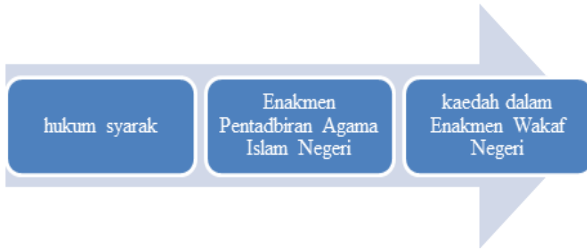
Rajah 1 Evolusi undang-undang pengurusan wakaf di Malaysia.

Sistem wakaf di Malaysia beroperasi di bawah kerangka tiga jenis undang-undang, iaitu hukum syarak, Enakmen Pentadbiran Agama Islam Negeri dan enakmen wakaf negeri seperti dalam Rajah 1: