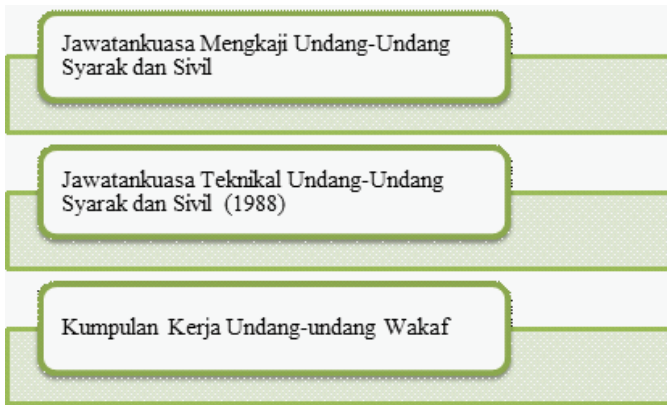
Rajah 5 Penubuhan jawatankuasa untuk penyeragaman undang-undang syariah oleh JAKIM.

Satu lagi langkah yang belum dilaksanakan oleh kerajaan persekutuan dalam usaha menyeragamkan undang-undang wakaf negara kita. Langkah tersebut ialah meluluskan Akta Wakaf untuk Wilayah-wilayah Persekutuan yang akan menjadi undang-undang contoh bagi pengurusan wakaf di negeri-negeri. Apabila usaha ini dilaksanakan, maka bolehlah Perkara 75 Perlembagaan Persekutuan diguna pakai bagi memantapkan lagi penyelarasan: